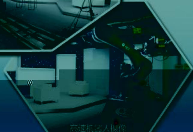
高速机器人操作室